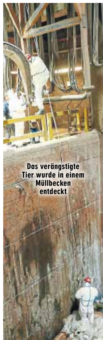
Das verängstigste Tier wurde in einem Müllbecken entdeckt