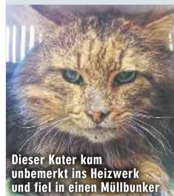
Dieser Kater kam unbemerkt ins Heizwerk und fiel in einen Müllbunker

Darmstadt - KATZastrophen-Alarm im Darmstädter Müllheizkraftwerk! Ein Mitarbeiter entdeckte gestern einen Kater in einem zehn Meter tiefen Bunker. Die Höhenrettung der Feuerwehr rückte an und befreite ihn mit einem Flaschenzug. Der Kater war vermutlich in einen Müllcontainer gesprungen und von der Müllabfuhr verladen worden. Er kam unverletzt ins Tierheim.